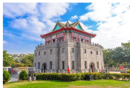
戰地精神的象徵【莒光樓】

『沙溪堡』：沙溪堡位在金門的離島烈嶼鄉，沙溪堡是以前的軍事重地，可清楚眺望大膽、二膽、檳榔嶼及廈門，現在重新規劃後，可以漫步在被海水包圍的木棧道上欣賞美景，也可以探索碉堡和坑道等軍事遺跡，還是個觀賞日落的好地方。