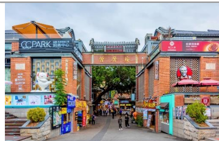
文藝氣息的小漁村【曾厝垵】

『曾厝垵』：曾厝垵被譽為最具文藝氣息的小漁村。現代與古樸的街區相融合，街上聚集了超多獨具個性的小店，邊逛邊吃、邊買邊拍，足夠你折騰一整天。